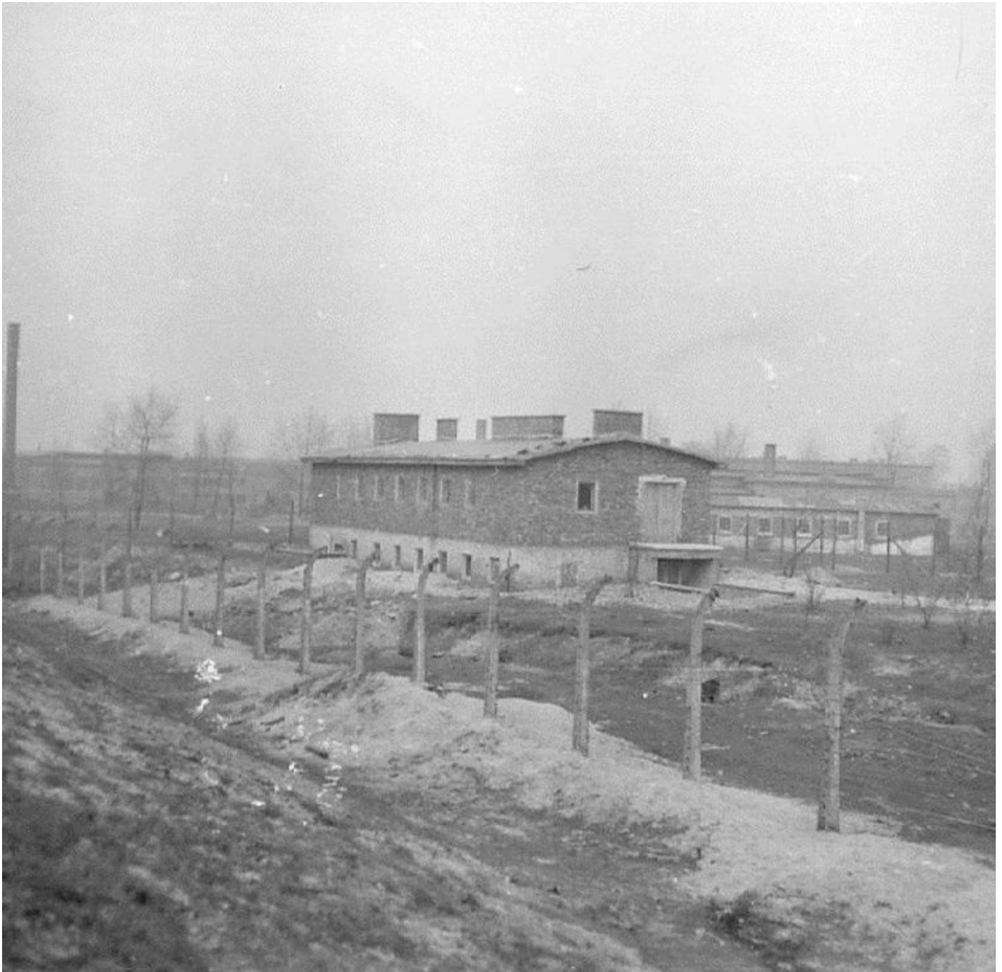
▲ Auschwitz, het gebouw voor het ontluizen van kleren van gevangenen.

BOEKRECENSIE Giorgio Agamben - Wat er overblijft van Auschwitz